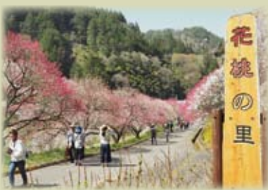
阿智村「花桃の里」。多くの人が集まる 当会の目標の桃源郷です